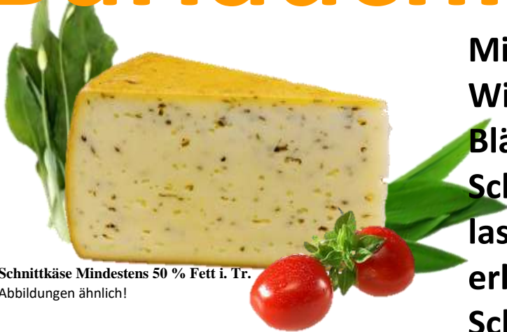
Schnittkäse Mindestens 50 % Fett i. Tr. Abbildungen ähnlich!

Mit der Würze des Frühlings. Wie wunderbar sich die grünen Blätter in einem cremefarbenen Schnittkäse aus naturbe- lassener Rohmilch machen, erleben Genießer hier bei Käse Schwendner!